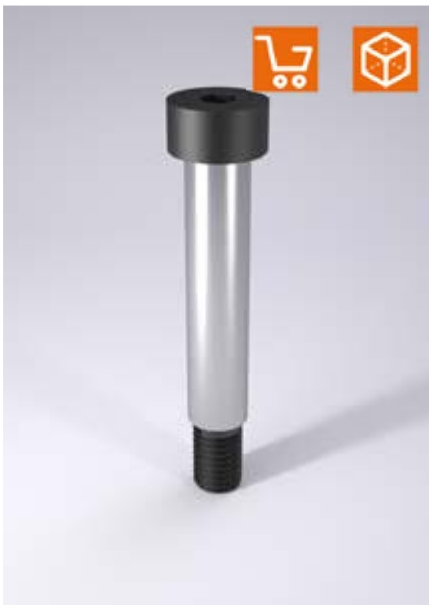
Ejemplo de montaje