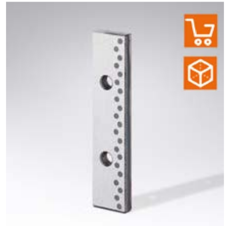
2961.81. Regleta cubre-guías, Acero con lubricante sólido, VDI 3357