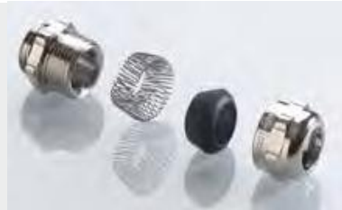
Abb. 2 Fig. 2

Messing vernickelt Metrisches Gewinde EN 60423 Mit O-Ring HNBR Schutzart IP 68 bis 15 bar, IP 69 Grundlage für technische Angaben: EN 62444