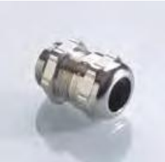
Abb. 1 Fig. 1