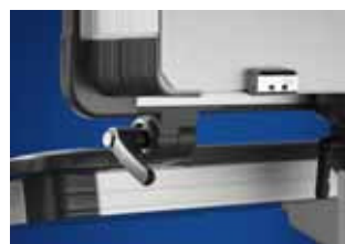
Rahmenverbinder, einstellbar für Comfort-Panel, Best.-Nr. siehe Seite 977.