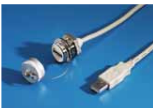
USB-/RJ 45-Verlängerung Best.-Nr. siehe Seite 1150.